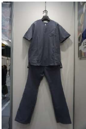
再生ポリエステル原着糸を使用した医療服