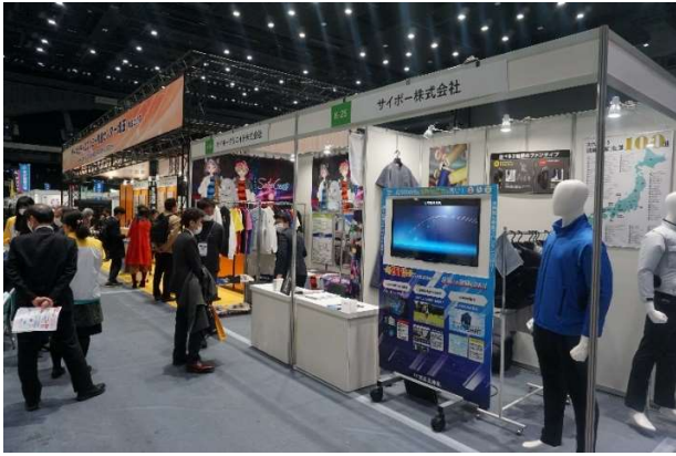
サイボー展示コーナー