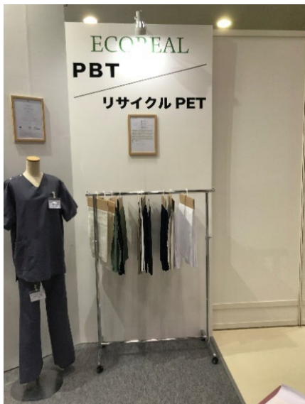
ECOREAL PBT・リサイクル PET