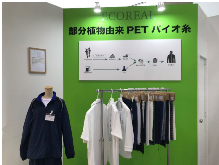
ECOREAL 部分植物由来 PET バイオ糸